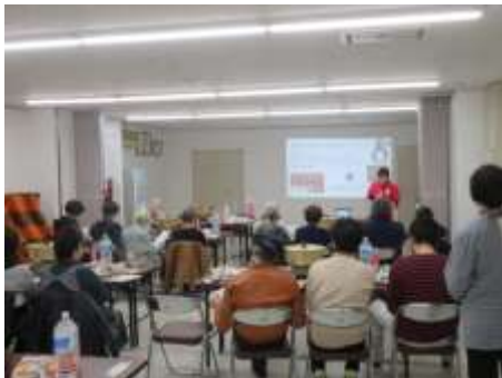
クッキング教室の様子